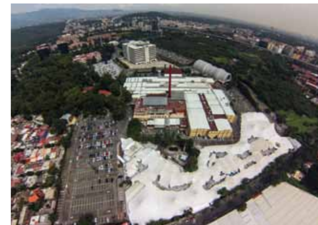
Plaza Inbursa, icono del sur de la Ciudad de México.