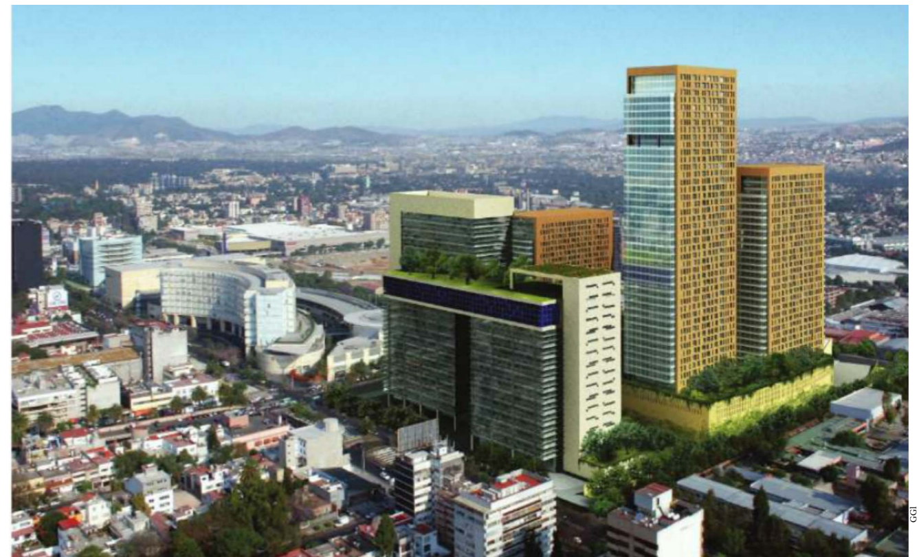
Miyana, proyecto de usos mixtos que se desarrolla en Polanco, Ciudad de México.