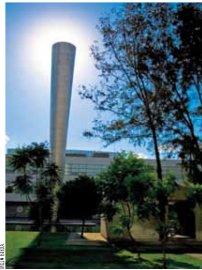
TécnoParque, primer Business Park de la Ciudad de México.

1.- Puede ser una única estructura de gran altura en un único sitio que contiene dos o más usos integrados en la estructura. Esta forma de desarrollo de uso mixto tiene por menor