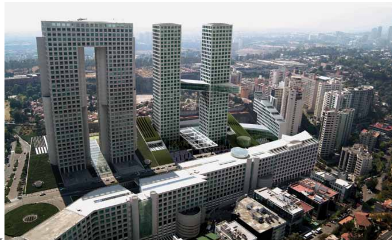
Hasta 2007, Arcos Bosques albergaba la torre más alta de la Ciudad de México.

Ante el “boom” inmobiliario que se registra, muchos proyectos que estuvieron detenidos durante la crisis de 2009, se están reactivando, algunas veces reciclando antiguas áreas urbanas o en nuevos centros urbanos. La mayor parte de estos desarrollos adoptarán formato mixto.