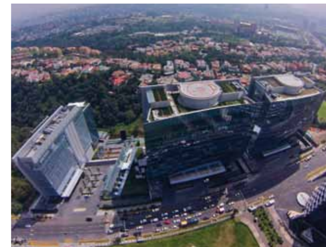
Park Plaza, obra de los arquitectos Fredy Helfon y Michael Edmonds.