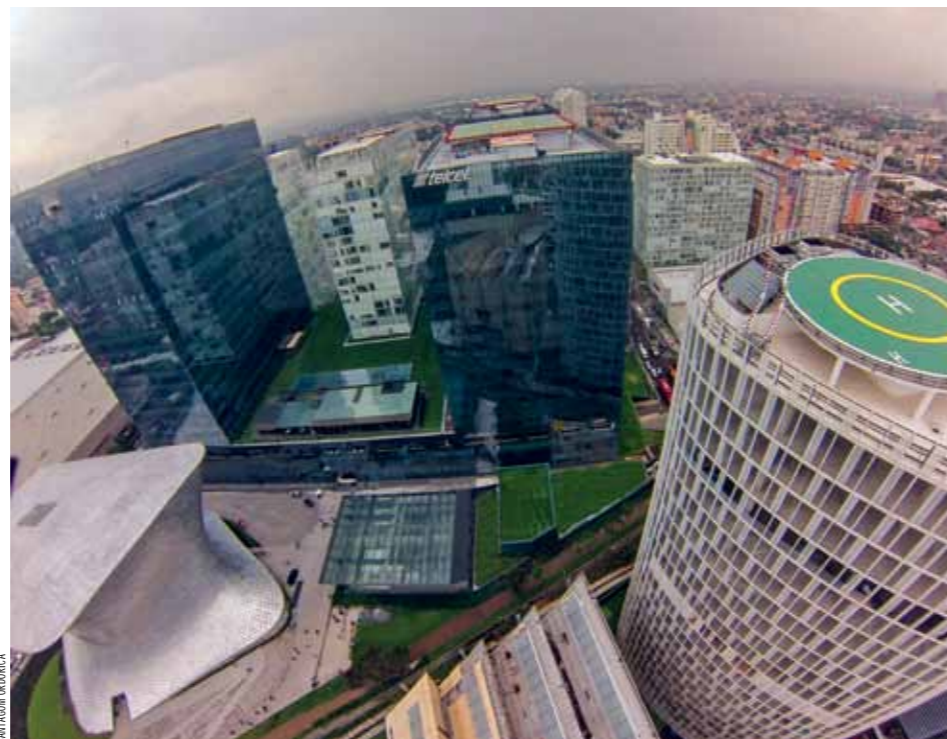
Plaza Carso, ejemplo de concepto corporativo, comercial y cultural en la Ciudad de México.