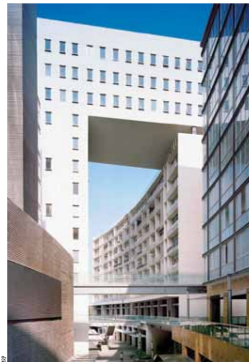
Parques Polanco, uso mixto que refleja la unificación del modelo de negocio.

4.- Puede ser una única estructura de media altura en un solo sitio, típicamente dentro de un entorno urbano con la venta al por menor en planta baja y residenciales u oficinas por encima, generalmente esta categoría se desarrolla en los proyectos de vivienda con comercio en planta baja.