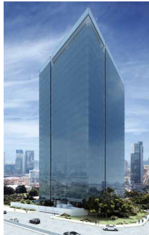
Espacio Santa Fe integra dos niveles de área comercial y 22 de oficinas.