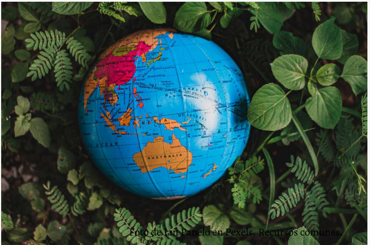
Recursos comunes

c. Retos que enfrentan los bienes públicos globales