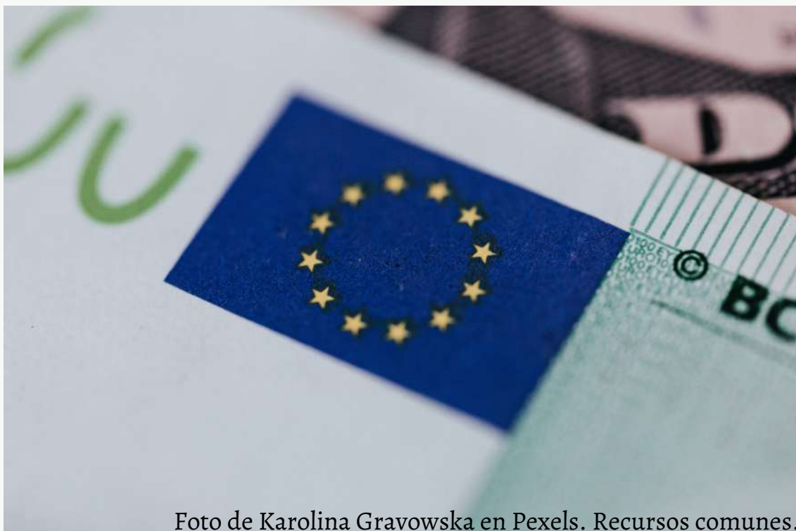
Recursos comunes.