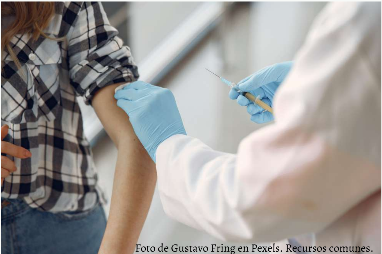
Recursos comunes.