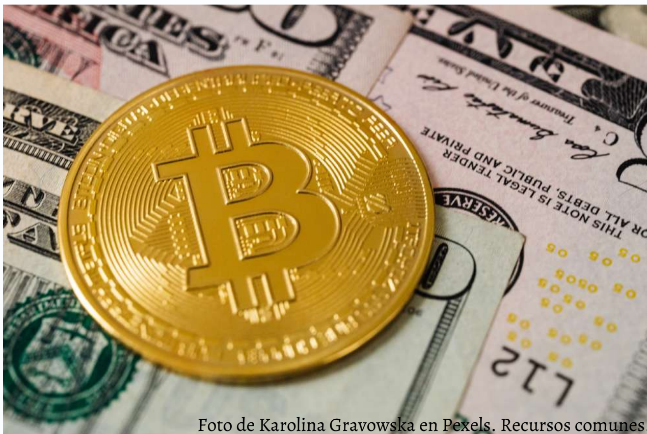
Recursos comunes.