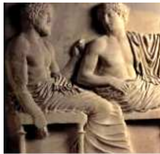
Calicles y Gorgias